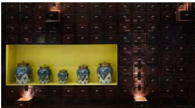
左图:药柜装饰的墙面 Left:Walls Decorated with Medicine Cabinet