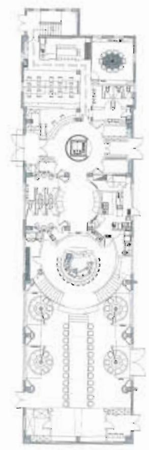
1ST FLOOR PLAN