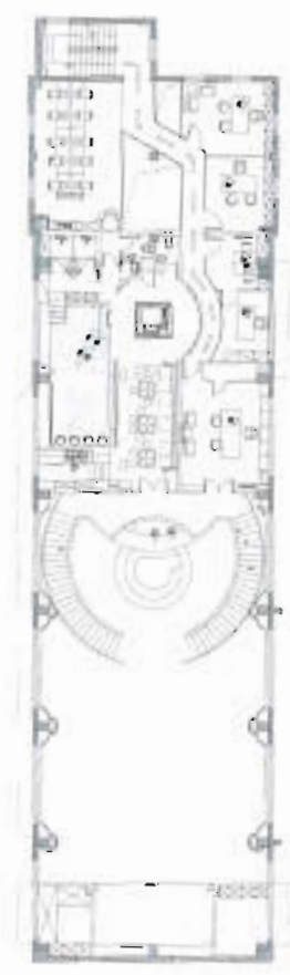
2ND FLOOR PLAN