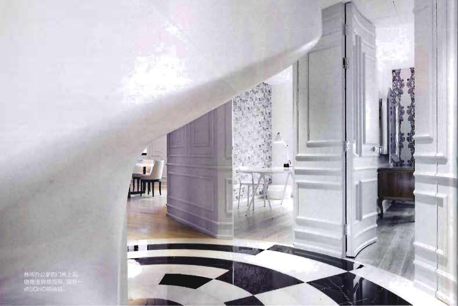
各间办公室的门关上后， 地板与墙形成圆形，还有一点SOHO的效果。