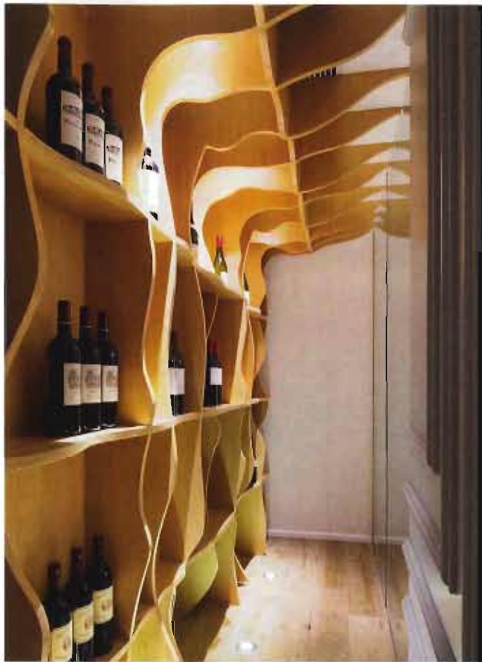
船龙骨造型的酒架颇具立体派意味。

员工和家人用餐的餐厅内,暖调的蓝灰色氤氲着整个空间的墙面,天花板和墙面上的木线条在古典和现代、工作与生活之间做着微妙的平衡。餐厅中央放置了一张十分独特的B&B几何形餐桌,搭配造型复古而舒适的PhilippeHurel的椅子。餐厅一隅的吧台是Paul一家享用早餐的地方,吧台后由玻璃围合而成的酒窖,能够清楚欣赏到酒柜里的藏酒,波浪纹的酒架灵感来源于Paul钟爱的船龙骨的造型。>