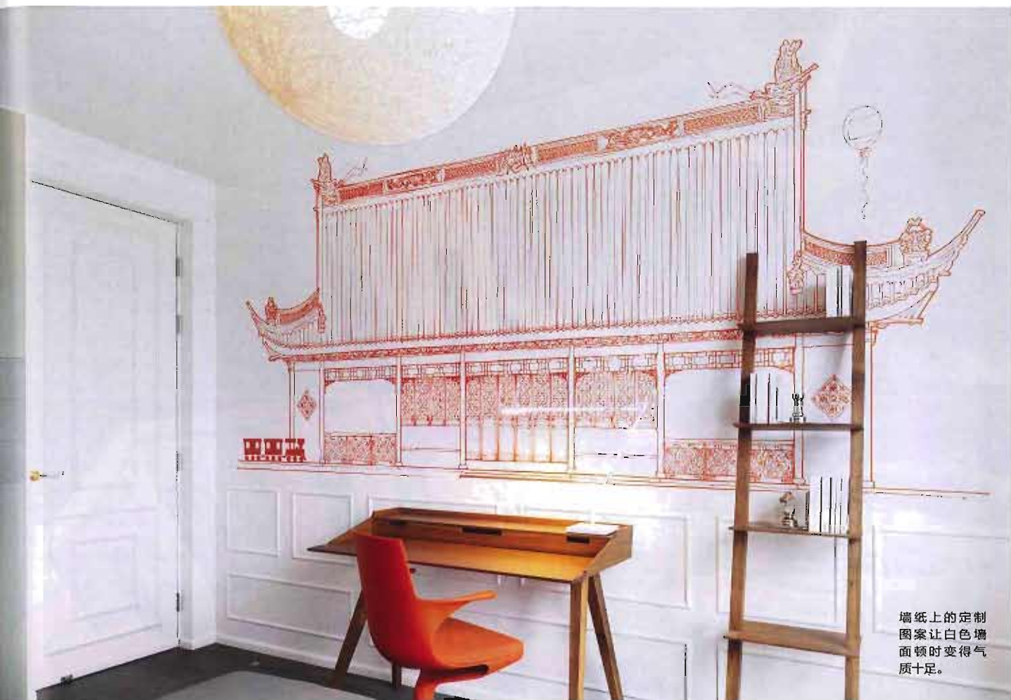
墙纸上的定制图案让白色墙面顿时变得气质十足。