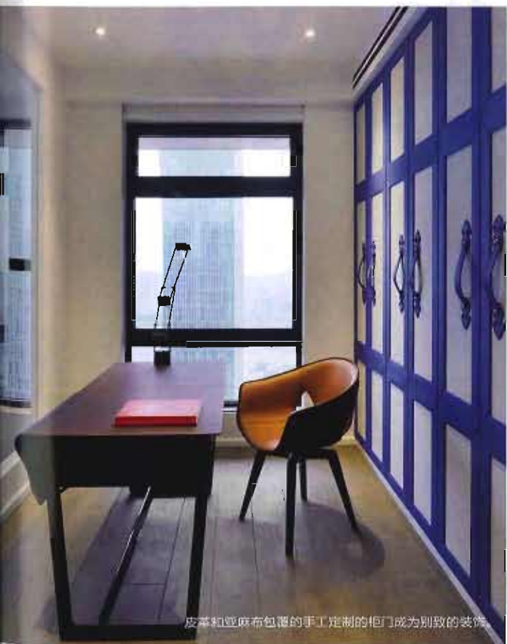
皮革和亚麻布包覆的手工定制的柜门成为别致的装饰。