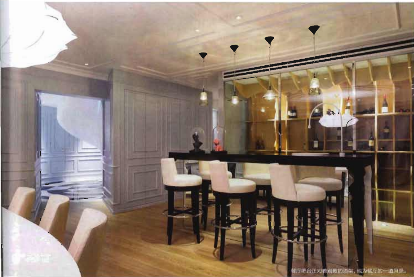
餐厅吧台正对着别致的酒架,成为餐厅的一道风景。