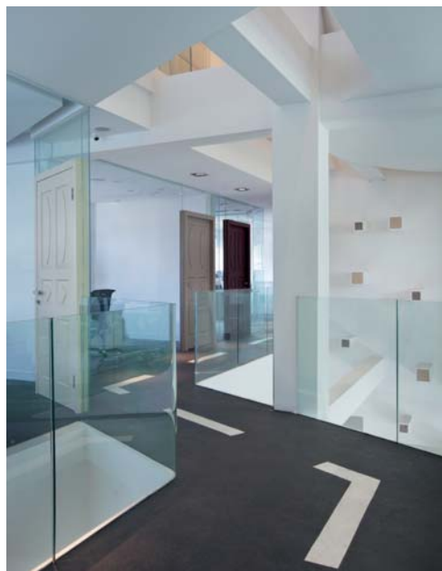
"Work in the Park".

اعتمد التصميم على السقف المفتوح لمزيد من الضوء ولغرف اكثر اتساعاً وليكشف في الوقت نفسه عن الهيكل الاصلي للمبنى. كما ان التصميم الداخلي يخلق جواً ودياً يفضله الزبون. بالنسبة للباحة فهي تمتد على ارتفاع ثلاثة طوابق ومفروشة بمكاتب بيضاء منفتحة بحيث تسهل التواصل بين الموجودين بغض النظر عن الطابق الذي يشغلونه.