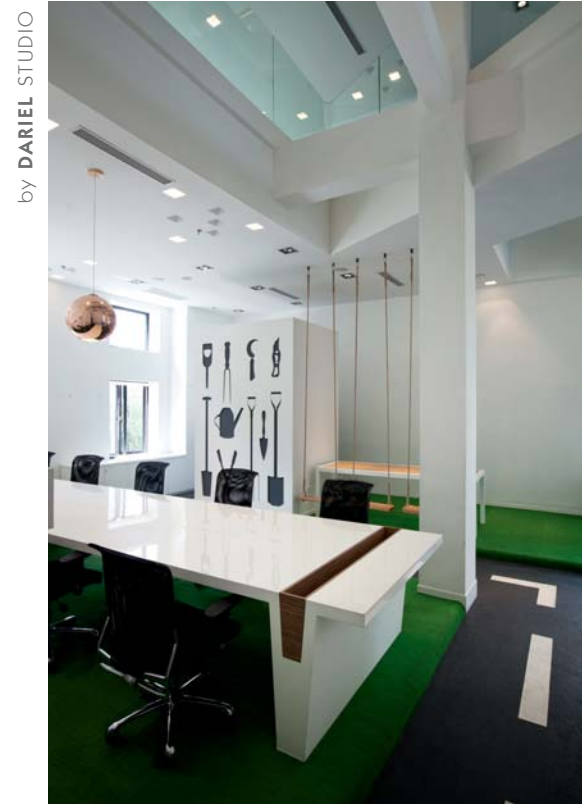
by DARIEL STUDIO

تم تصميم الإضاءة لتتبر المساحة بشكل مشابه للإضاءة الطبيعية في الخارج، اما اللون الابيض المستخدم فيعكس النظافة والوضوح بعد ان كان المكان داكناً عندما كان يشغله المصنع.